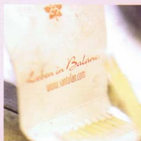
High-Tech meets Low-Tech: Im Labor herrschen strenge Hygienevorschriften.