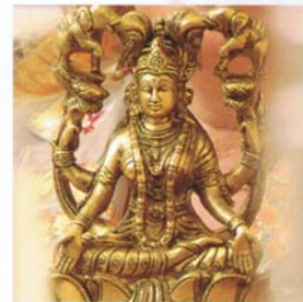
Namensgeberin Lakshmi. Die grazile indische Gottheit verkörpert Glück und Schönheit.